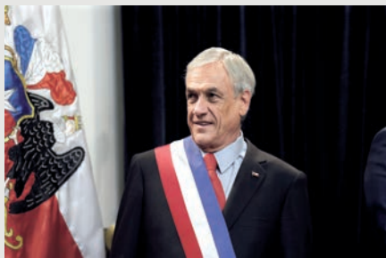
SEBASTIÁN PIÑERA Chiles neuer Präsident gilt nicht als Freund des Mapuche-Volks.